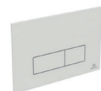
Oleas M2 bedieningspaneel R0121AC

voor wandcloset exclusief bedieningspaneel breedte 500 mm diepte 120 mm