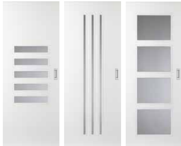
AE25 AE13 AE34