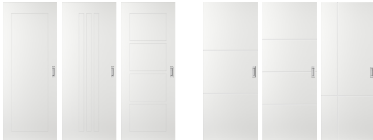
AE61 AE53 AE74 FM52 FM53 FM55