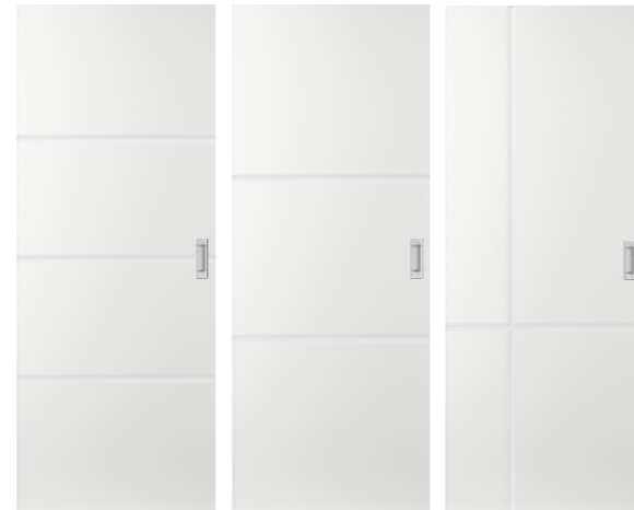
NDB950 NDB951 NDB953